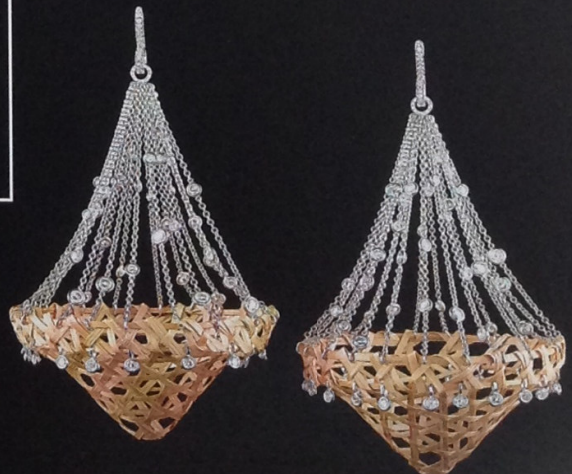
Серьги из золота и «золотой травы» с бриллиантами

ния высокого ювелирного искусства. Братья Кампанья славятся любовью к натуральным материалам — бамбуку и соломе из местной «золотой травы». Восемь предметов коллекции соединяют в себе натуральные волокна, золото и бриллианты. На создание коллекции ушло восемь месяцев — каждый предмет сделан полностью вручную. Коллекция получила название Dangerous Lixigu — «Опасная роскошь». Возможно, название имеет отношение к цене — от 35 до 65 тысяч долларов за одну вещь.