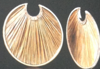
Серьги из золота и травы с бриллиантами

Римский ювелир Фабио Салини вступил в необычное сотрудничество с бразильскими мебельщиками братьями Фернандо и Умберто Кампанья, создав коллекцию, в которой недорогие материалы сочетаются с драгоценными. Результат — произведе-