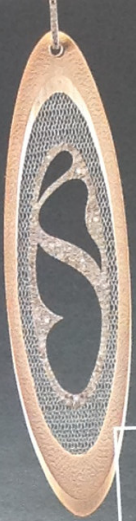
Серьги из золота и бамбука с бриллиантами