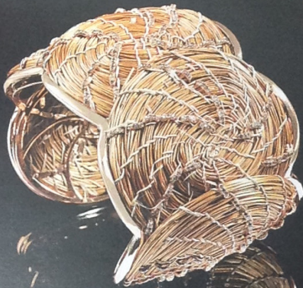
Браслет из золота и «золотой травы» с бриллиантами