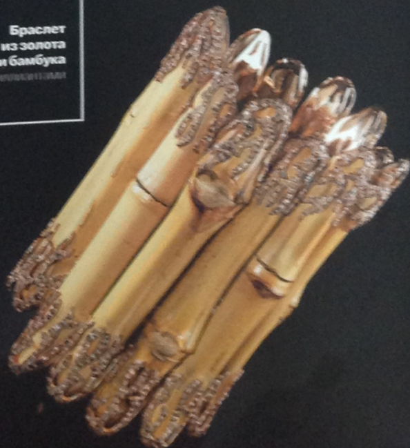
Браслет из золота и бамбука с бриллиантами